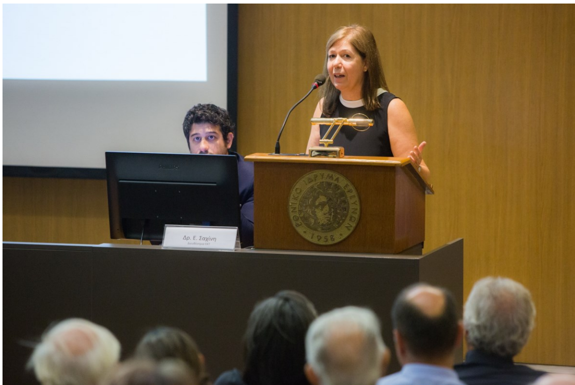
Η διευθύντρια του ΕΚΤ Δρ. Εύη Σαχίνη