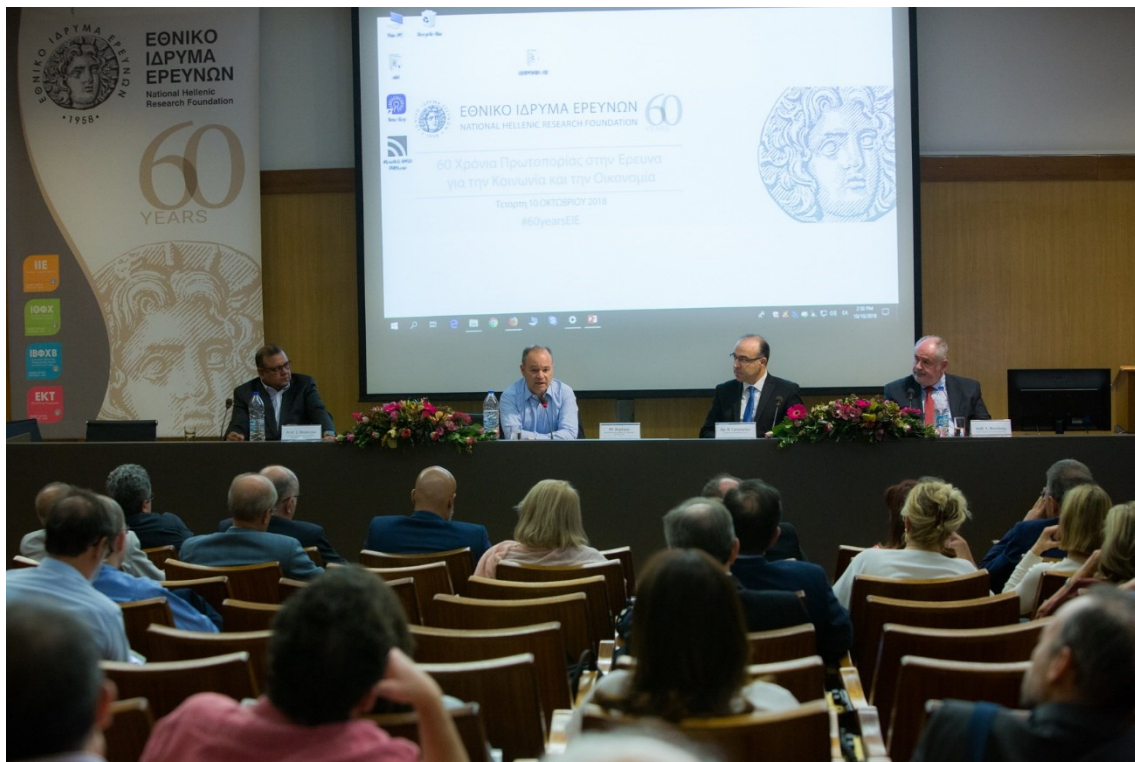
Από την συζήτηση με θέμα_Έρευνα και Καινοτομία στη Νέα Οικονομία της Γνώσης