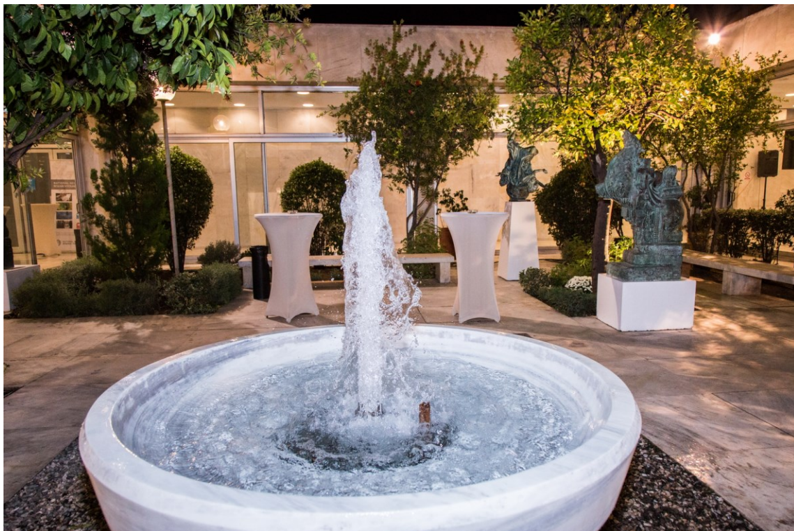
Το αίθριο του ΕΙΕ