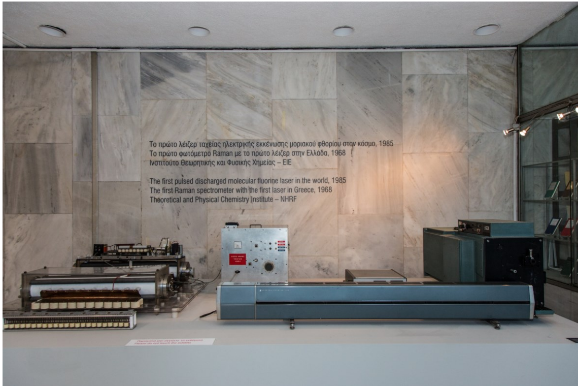
Το πρώτο laser στην Ελλάδα