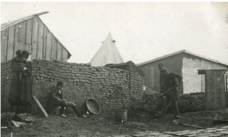
Building a home out of mud bricks, 1923 στο Armen T. Marsoobian, "Reimagining a Lost Armenian Home – The Dirdilian Photography Collection", I. B. Tauris (2017), σελ. 206

Με την ολοκλήρωση του έργου αυτού, το 2023, στοχεύουμε να έχουμε δημιουργήσει έναν χώρο –φυσικό στις πόλεις αναφοράς και ψηφιακό μέσα από τον ιστότοπό μας– όπου η προσφυγική και μεταναστευτική ιστορία της Ελλάδας μέσα από προσωπικές αφηγήσεις ανθρώπων που πήραν τον δρόμο της προσφυγιάς και της μετανάστευσης, αρχαικά τεκμήρια και υλικά αποτυπώματα της εμπειρίας αυτής θα παρουσιάζεται, θα τεκμηριώνεται και θα είναι προσιτή και προσβάσιμη στο ευρύ κοινό.