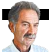
ΓΡΑΦΕΙ Ο ΓΡΗΓΟΡΗΣ ΑΖΑΡΙΑΔΗΣ

Στο «Γκραν Παρί» οι δολοφονίες περιθωριακών ατόμων αποκρύπτονται για να χαμηλώσουν οι δείκτες εγκληματικότητας σε διάφορες περιοχές