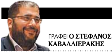
ΓΡΑΦΕΙ Ο ΣΤΕΦΑΝΟΣ ΚΑΒΑΛΛΙΕΡΑΚΗΣ

Τ ο Εθνικό Ιδρυμα Ερευνών έχει παίξει μεταπολεμικά ίσως τον πλέον καθοριστικό ρόλο στην αποκρυστάλλωση του 1821 και της ευρύτερης διαμορφωτικής περιόδου, στη χάραξη ενός δύσκολου, αλλά δημιουργικού ιστοριογραφικού δρόμου για την περίοδο συγκρότησης και διαμόρφωσης του Νεότερου Ελληνισμού. Τάσεις, νοοτροπίες, ιστορία ιδεών, κοινωνικές ομάδες, κοινωνική και οικονομική ιστορία, Διαφωτισμός και πολλές άλλες θεματικές βρίσκονται ανάμεσα στις ερευνητικές θεματικές που κατά καιρούς ανέδειξε το Ιδρυμα. Κατά συνέπεια είναι λογικό στα 200 χρόνια από το 1821 να έχει μια