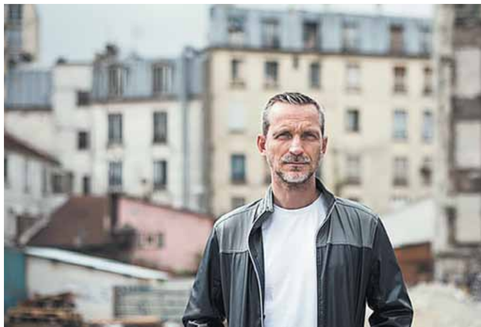
Ο Ολιβιέ Νορέκ σε προάστιο του Παρισιού

Μτφ. Χαριτωμένη Βόντα Εκδ. Ελληνικά Γράμματα, σελ. 382 Τιμή 15,50 ευρώ